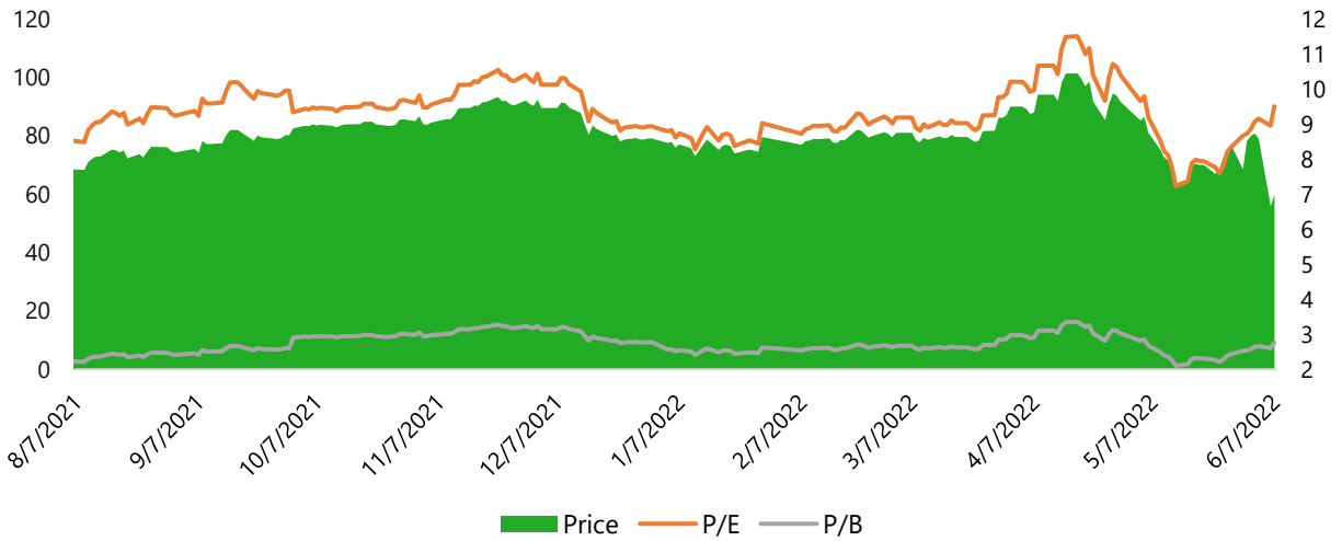
BIỂU ĐỒ GIÁ